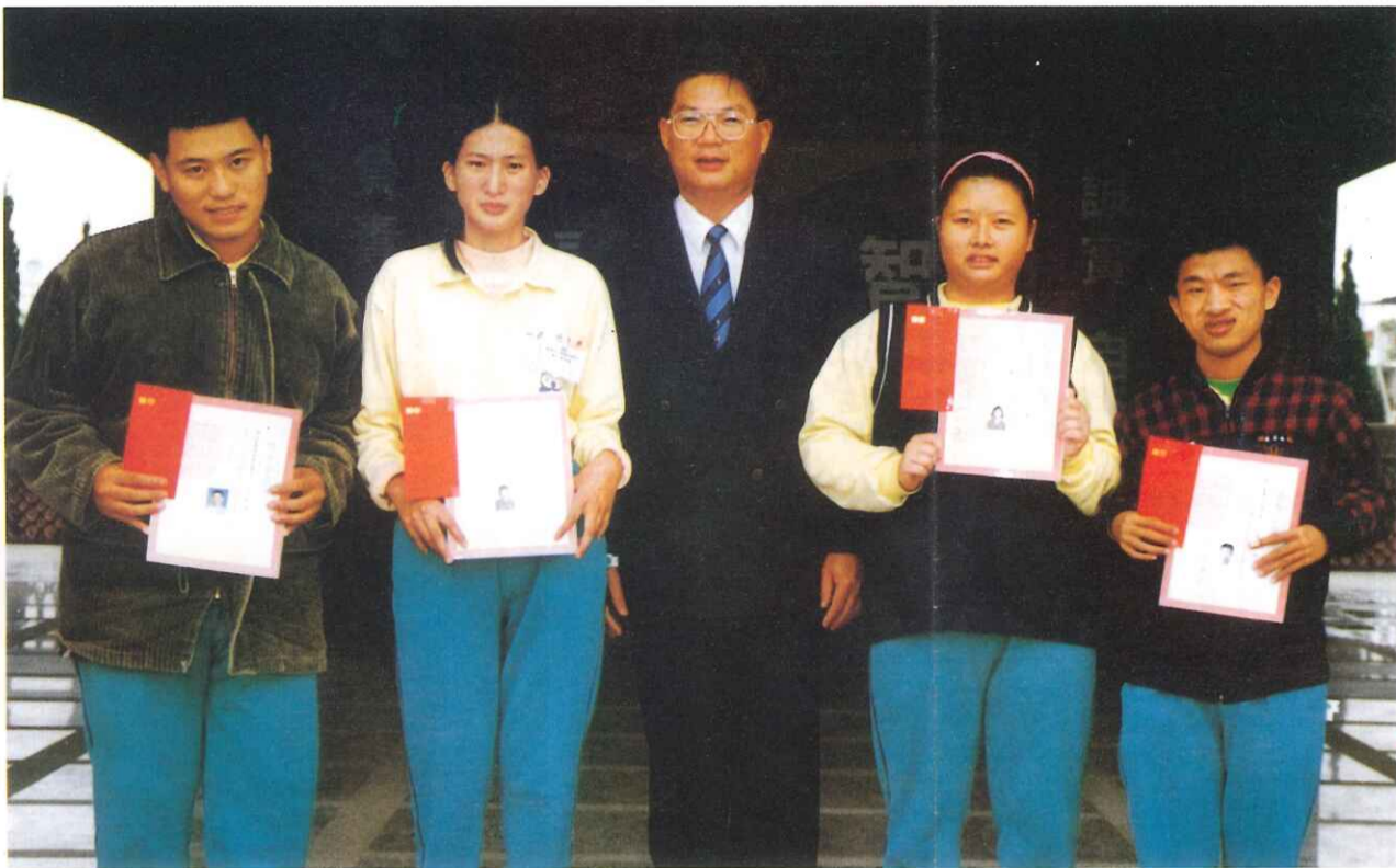
▲邱校長與四名獲得「宗俾章教育基金會」獎助學金學生合照