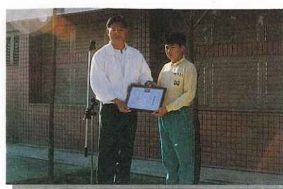
◆ 頒發嘉智小市長當選證書