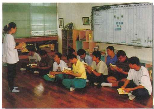
性教育小團體之實施