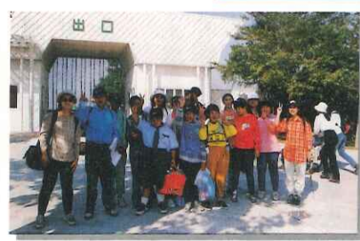
◆ 頑皮世界校外教學活動